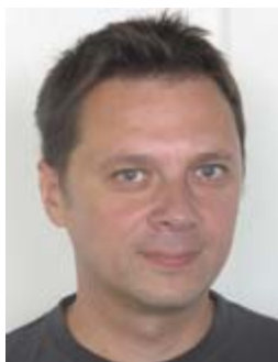
Piše: Daniel OMERAGIĆ

• Dobra euroatlantska integracija Bosne i Hercegovine ključna je za dugoročnu stabilnost Balkana • Uknjiženje 69 lokacija sa perspektivnom vojnom imovinom na Ministarstvo odbrane BiH je uslov za početak primjene prvog godišnjeg plana iz MAP-a, ali i test za našu zemlju • NATO zaokupljen izradom novog strateškog koncepta, koji treba da odgovori na buduće izazove