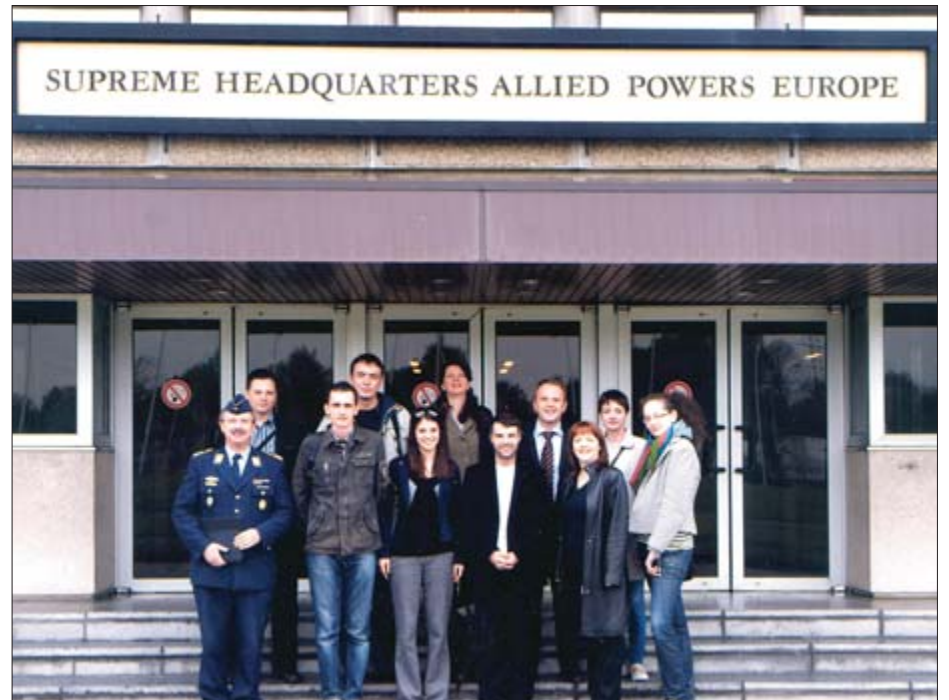
Grupa novinara i predstavnika nevladinih organizacija iz BiH posjetila je SHAPE

Kruna tog dijela puta je učinjena 2. oktobra 2009, kada je tadašnji predsjedavajući Predsjedništva BiH Željko Komšić u Bruxellesu predao generalnom sekretaru NATO-a Andersu Foghu Rasmussenu aplikaciju za prijem BiH u MAP. Aplikacija je razmatrana već na ministarskom sastanku u decembru prošle godine. Tada je zaključeno da BiH nije ispunila uslove za dobijanje MAP-a, ali i da vrata NATO-a ostaju otvorena za našu zemlju. Ipak, u međuvremenu do neformalnog sastanka održanog u Tallinnu stvari se promijenile. BiH je donijela odluku o uništavanju viškova naoružanja i municije te o slanju jedinice Oružanih snaga u Afganistan. Ministri vanjskih poslova zemalja čla-