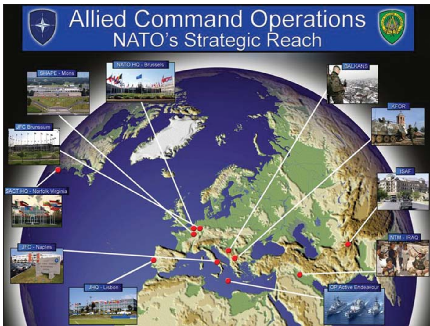
Komandni centri i operacije

Dominirale su teme posvećene pripremi novog strateškog koncepta NATO-a, trenutnim operacijama koje izvodi u svijetu, Bosni i Hercegovini i njenom putu ka euroatlantskim integracijama, odnosima NATO-a i Rusije i na koncu relaciji NATO - Evropska unija. Poslije političke, prezen-